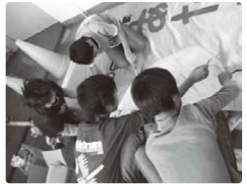
作品展の準備作業