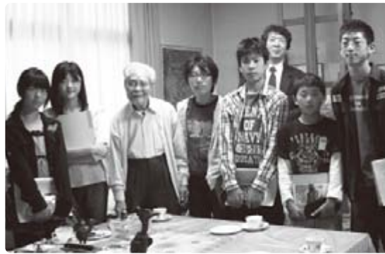
上組小学校6年生と共に